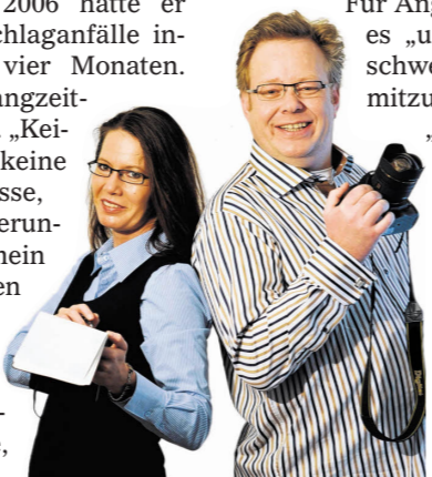
AUTOREN: SABINE EISENMANN UND JÜRGEN BUXMANN.

Ihr Kontakt zu den SüWo-Autoren: Telefon 06257 990611, E-Mail: buxecho@aol.com.